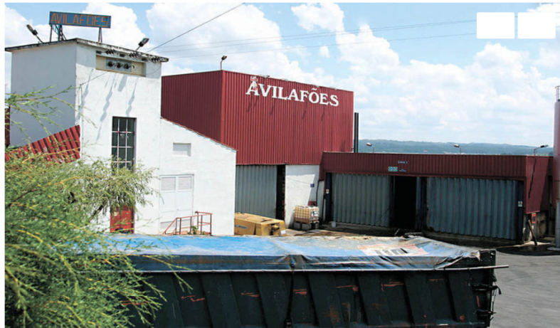
Insolvência da Avilafões foi pedida em 2010 por dois sócios minoritários